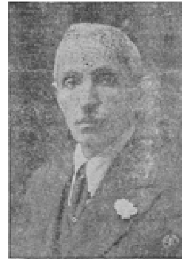
ئەمین زه‌کی به‌گ

تکایه ئەم په‌رسیاره‌م ئاراسته‌ی وه‌زیری به‌رگرییه با وه‌لامی بداته‌وه: