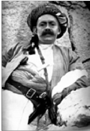
شيخ مه حمودى حه فيد

فهوتيه رانه ي به سهريان هاتووه له بير ناچيته وه. هه رجاريش كه قسه و به لئنه ههنگرينيه كاني خويان دووباره دهكه نه وه، بى شهوه ي كه به كاروكرده وه بينه ناو مهيدانى واقيعه وه، خويان دهكه نه گالته جار و بيزليه تهنه وهى خه لك.