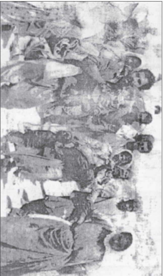
(دانیلت هيج كه سيك بفرشته ژنر نه شكسته چندان يا سزايك يا خود مامه نه يه يكي توند و تيرش يا نامروفته يان ناروويوهر ...). به نژدی (7) نه پييمانی تيروده نه تی تايهت به مافه باژرفانی و پوښتيکيه مکن (1966)