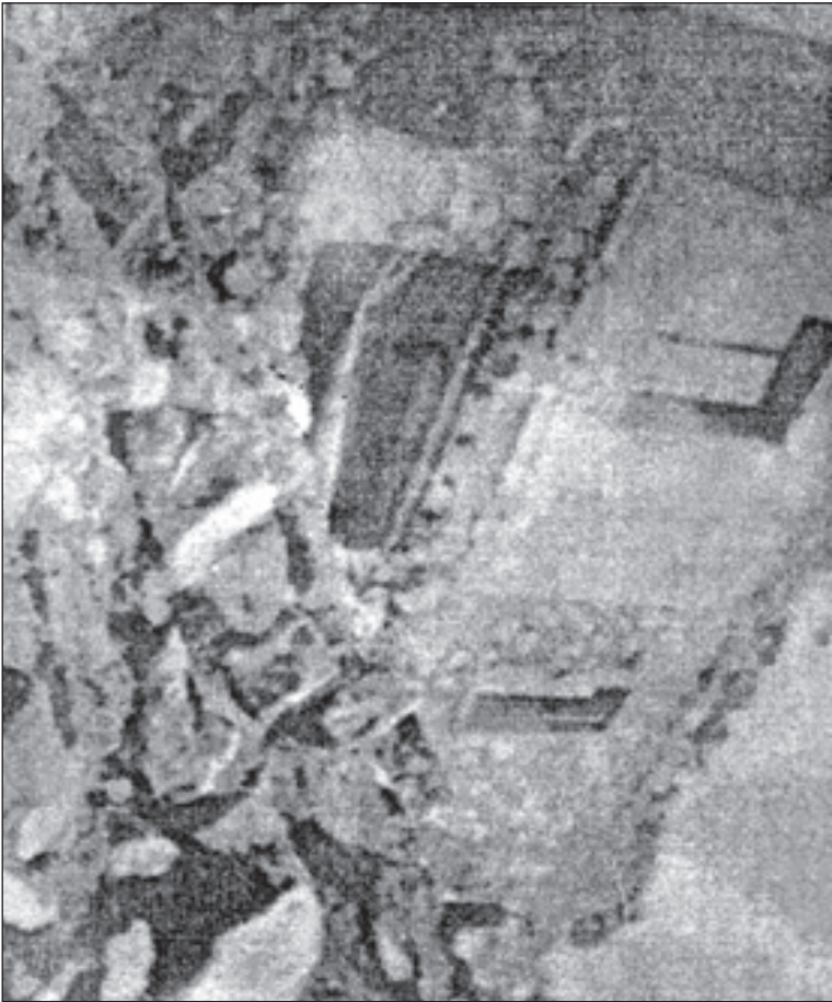
بەندگی 18 ئەجەزای جیهانی مافی مەزوق دەت: ھەمووگەسێک مافی نازاری بێکردنەو و ویژدان. ھەبە (( بەندی 19 ئەھمان چارنامدا دینی: ((ھەمووگەسێک مافی نازاری بیرو و رادەپەری ھەبە (( لێرەدا ئەسایەتی جەگم و رۆژگەر شوقیست و پاوانگەزان و تیزرستەکانی دژ بە بیری کورایەتی (نازاریگەکان) ناو وەلام دراونەتەوو (11)