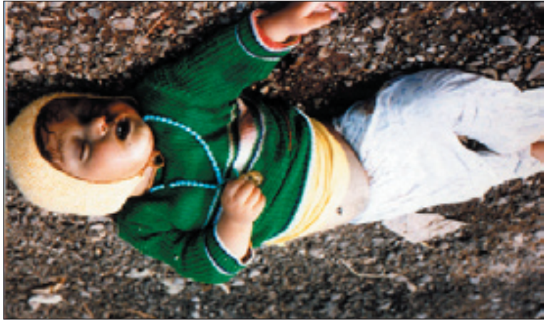
چەكسى كىمىيىسى (لەژىر ناوى تردا) ئەمەيان لە زۆر بىروانامەى نۆدەوئە تىيدا ياساغ كراو، ئەوانە (جاپنامەى سان پىترسبۇرگ 1868)، رىككە و تىنامەكانى لاهای (1899 و 1907)، بەندى 1/23 لە ھەردوو كياندا و پەيمانى فېرساى 1919 و پىرۆتوكۆلى جىنىف 1925. بەدرىژاىى ئەو وەختانە، ئەو جۆرە چەكانە تەنھا لە دژى دوژمندا بەكار ھاتوون، كە چى رژیەى بەغدا، وەك پىشپىنەىيەك لە دژى خەلكانىكدا وەكارى خست كە رەگەزنامەى ولانەكەيان ھەنگرتووہ.....!