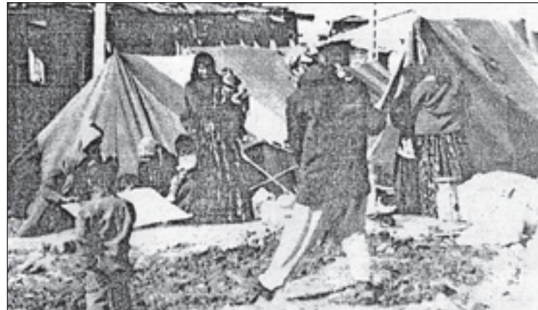
پهيمانى نيودهوتى تاييهت به مافه باژيرقانى و سياسيهكان (1966) له بهندى (1/12) يدا دهئى: (ههركه سېك كه به ياساى له نينو نيقلېمى دهوتىك دايه، مافى به نازادى هات و چو و هه لېژاردنى شوئى نېشته چى بوونى ههيه) ههروا بهندى (3) ئە چارى جيهانى مافى مروفا دهئى: (هه موو كه سېك مافى زمان و نازادى و ناساپشى خوى ههيه) و بهندى (2/17) ئە هه مان جارنامه دهئى: ناييت به رهمهكى موئك له هيج كه سېك به نرېته وه، رژيم پياده كردنى نهو بروا نامانهى به ته رجيل و ته هجير له سنورى كوردستان و عيراقدا دهستپيكرد. لېروه: سه رته تاكلانى جيهه جيكردنى پلان و نه خشهى ئيباده كردن.