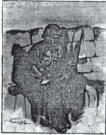
رسالة من جبهة القتال