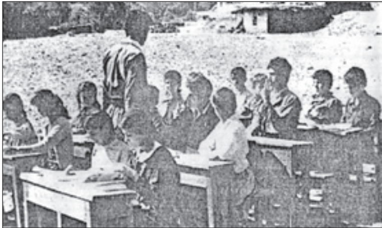
بەندى 1/26 ئە چارى جيهانى مافى مروفا دهفتووسى كردوو كه: (هه موو كهس مافى فېربوونى ههيه....) ههروا ههسان بهندى 2/26 دهئى: دهسى نامانجى پهروهرده، ينگه ياندينكى تهواوى كه ساپهتى مروفا و پتهوكردى ريزى مافهكانى مروفا و نازاديه بنه رتهيهكان و گه شه پيدانى به يهك گه شستن و چاوپوشيكردن و دوستايهتى له نينوان هه موو كه لان و...) نه مه يان له ساپهتى شوژشى مقاومهتى ئيباده (شوژشى له يول) به پيسى ئيمكان و تا رادهيهكى له بار هه راهه م بوو. به لام له ساپهتى رژيمدا، چون مافىك و چ جوهره پهروهرده و ينگه ياندينكى؟! له چ بروا يه كه وه؟.