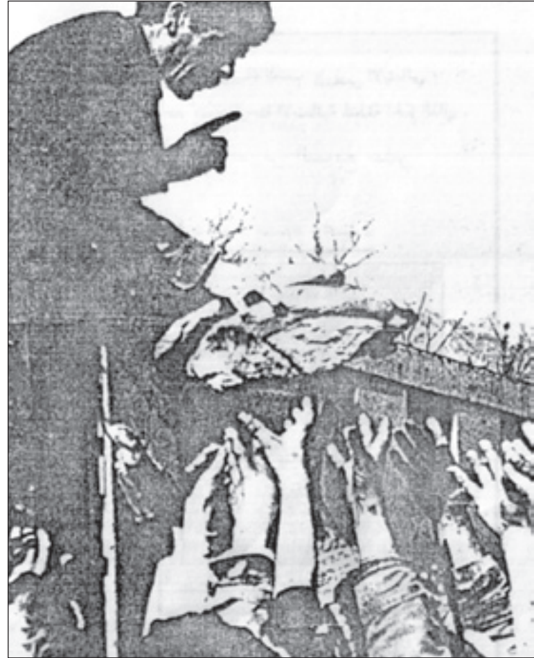
پەيمانى نۆدەئەتسى تايبەت بە مافە نابوورى و رۆشنىبىرى و كۆمە لايە تىيەكان (1976) كە عىراق لايەنىكە تىيدا، لە بەندى (1/11) يدا پەنچە بۆ ئەو رادەكىشى كە دەوئە تانى ھاوېھش دان بەو دادەئىن كە ھەموو كەسىك، خۆى و خىزانەكەى، مافى ئەوھى ھەيە لە ناستىكى ژيانى لە باردا بژىت، بە شىوھىيەك كە پىنداوىستىيەكانيان لە (خواردن) و جل و بەرگ و شوئىنى ھەوانەوہ بۆ مەيسەر بگىرت...!