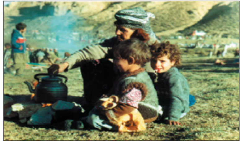
((... ئەنگیدی فرمانەکان دەکەینەو بە تەقەکردن لەووی کەھەوێ گەرانەووە بۆ نیو خاکی عێراق دەدات، ئەوانە کە راگۆیزراون . تەواو.....))

بروسکە ی نەینی وەزارەتی ناوخۆی عێراق ژمارە 2884 ئە 10/4/1988