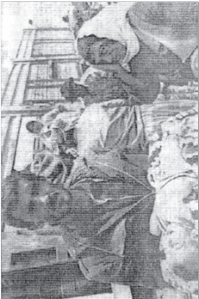
تاواله کانی دژ به مروفايتی، له ههر کوييه ک نه چامدراين، چيکای نيکو تيره وويه و نه و کسانه ک به يه نگی نه وويان له سر هه يه که نه و کسانه يان نه چامدرايت، چيکای به دواو چون و وه ستان و (توفيف) و دادگای کردن، نه گهر تاوانباران دهر چون، سزا دهرين ... (1)