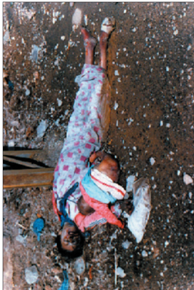
جاری جبهائی مافہکائی مروفق له بهندی (2/25) پيدا ده تی: دایک و مندال مافی یاره تی و چاودیزیکه تایبه تیایان هدی. له همدان پات کردنه ویشدا، بنه مای دوهم له جاری مافهکائی مندال (1959) پاریزگارکردنی تایبه تیای مندال پیوست دهکات: رژیمی بدخدا به و رهنگی کده بیینش نیبترای به و پروانمه نیوه و نه تیانه وه کردوو !!!